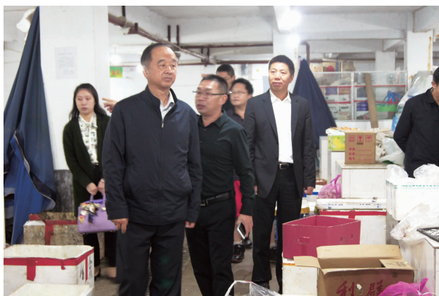
我会领导陪同江西省商务厅王副巡视员一行以及石柱县有关领导前往西沱镇考察对口援建项目和顺佳园农贸市场