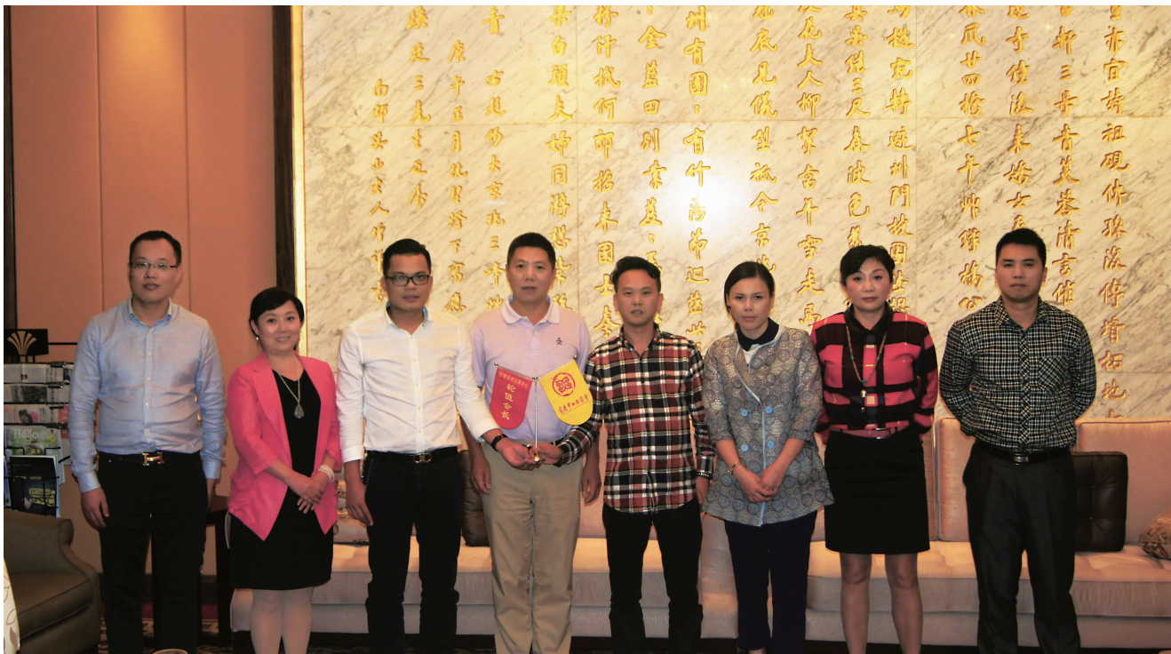
轮值会长交接仪式