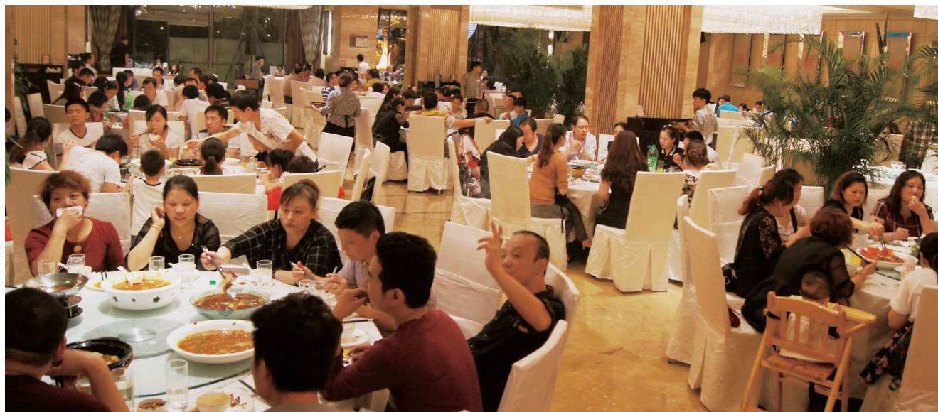
会员间相互交流其乐融融