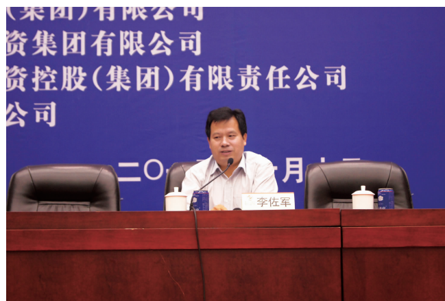
经济学家李佐军演讲中

国务院发展研究中心、著名经济学家李佐军用大量数据从宏观和微观两个方面对当今的经济形势和新的经济增长点进行深入的 analysis, 对企业在新形势下面对的机遇和挑战, 如何重新定位如何创新发展提出了宝贵的建议。