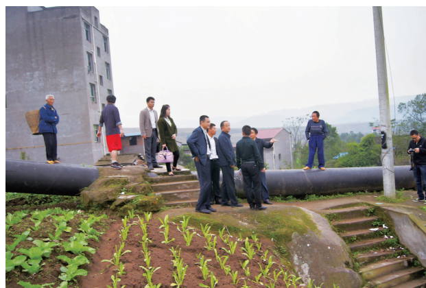
我会领导陪同江西省商务厅王副巡视员一行以及石柱县有关领导前往西沱镇考察对口援建项目老虎洞人行梯道

这次考察让我会领导感受到石柱县的发展潜力以及浓浓的土家族风情。我会将在今后加强对石柱县的宣传,对教育等基础设施进行援建,参与到石柱县的开发建设中。