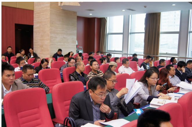
我会理事单位代表认真听课

他认为随着转型发展阶段的到来,中国经济将面临如下九方面问题与挑战:经济增速下滑带来挑战,通胀长期化带来挑战,经济泡沫累积带来挑战,经济增长动力结构转型带来挑战,产业结构和区域结构调整带来挑战,资源环境约束加大带来挑战,经济发展的社会成本增加带来挑战,经济发展的国际环境恶化带来挑战,改革阻力增加带来挑战。问题与挑战并不可怕,可怕的是我们不知道它在哪里。认清了问题和挑战之后,我们完全可能应对好挑战,在应对挑战中不断前行。