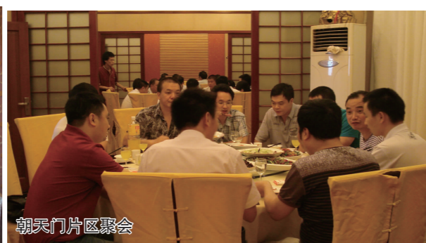
朝天门片区联谊会

我会成立两年来,商会的建设和管理在不断的发展和完善的,商会各项工作都取得了一定的成绩,2010年度我会首次参与重庆市工商联考核被评为“市优秀商会”。但用高标准严格要求来衡量商会工作,还有不少方面需改进和提高。尤其是如何全面提升商会凝聚力方面亟待加强。由于我会会员人数较多,分布范围较广,活动经费有限,不可能每次活动都邀请全部会员参加,通常每年只是在春节前举办一次会员大会,这样使得会员间的沟通、交流欠缺,在一定程度上影响了商会的凝聚力。为了进一步