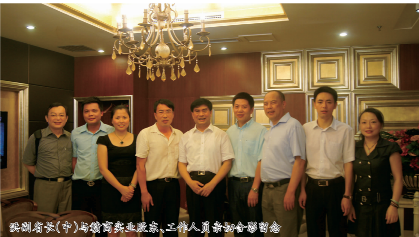
洪副省长(中)与赣商企业家、工作人员合影留念

了高度的赞赏,并希望在外游子们能常回家乡江西看看,身体力行,为江西的发展贡献自己的一份力量。 次日,我会部分领导陪同洪副省长一行参观了渣滓洞、白公馆、周公馆等,缅怀革命先烈。