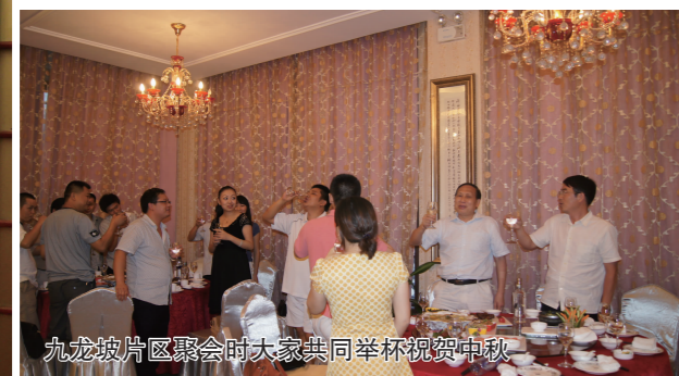
九龙坡片区联谊会与大家共同举杯祝贺中秋