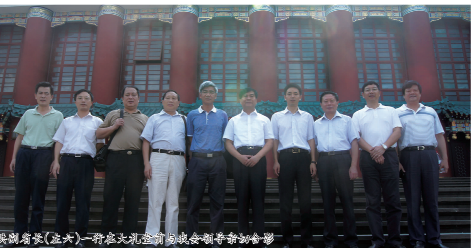
洪副省长(左六)一行在朝天门片区联谊会接见我会部分领导合影