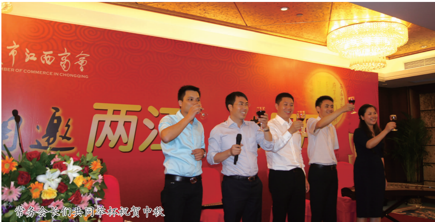
赣商艺术团精彩演绎赣剧