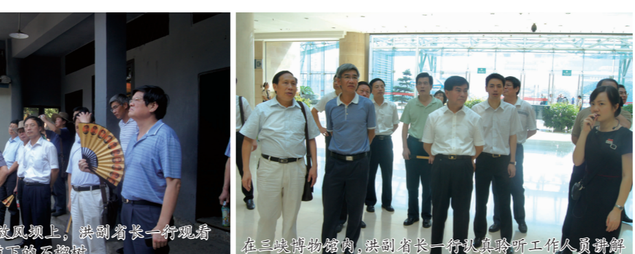
洪副省长一行在朝天门片区联谊会接见我会部分领导