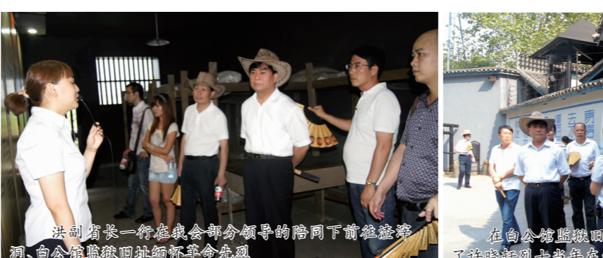
洪副省长一行在朝天门片区联谊会接见我会部分领导