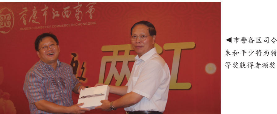
市警备区司令朱和少将获特等奖获得者颁奖

希望在渝赣商商人要继续发挥桥梁和纽带作用,宣传重庆,宣传江西,促进优势互补,实现共同发展;要继续发扬“爱拼敢赢”的精神,加快转变经济发展方式,积极投资“十二五”规划提出的重点产业、新兴产业,做大做强企业,为推动重庆、江西的经济发展贡献更大力量。