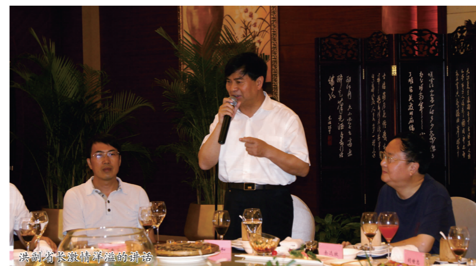
洪副省长一行在朝天门片区联谊会接见我会部分领导

2011年8月29日,江西省副省长洪礼和一行在重庆亲切会见了我会部分领导。重庆市人大常委会副主任、党组副书记余远牧同志、重庆市警备区司令朱和少将陪同。期间,洪副省长与在场的赣商们进行了亲切友好的交谈并共进晚餐,共叙乡情,为促进重庆和江西的经贸往来加强沟通和交流。洪副省长对我会为重庆的经济发展做出的成绩给予