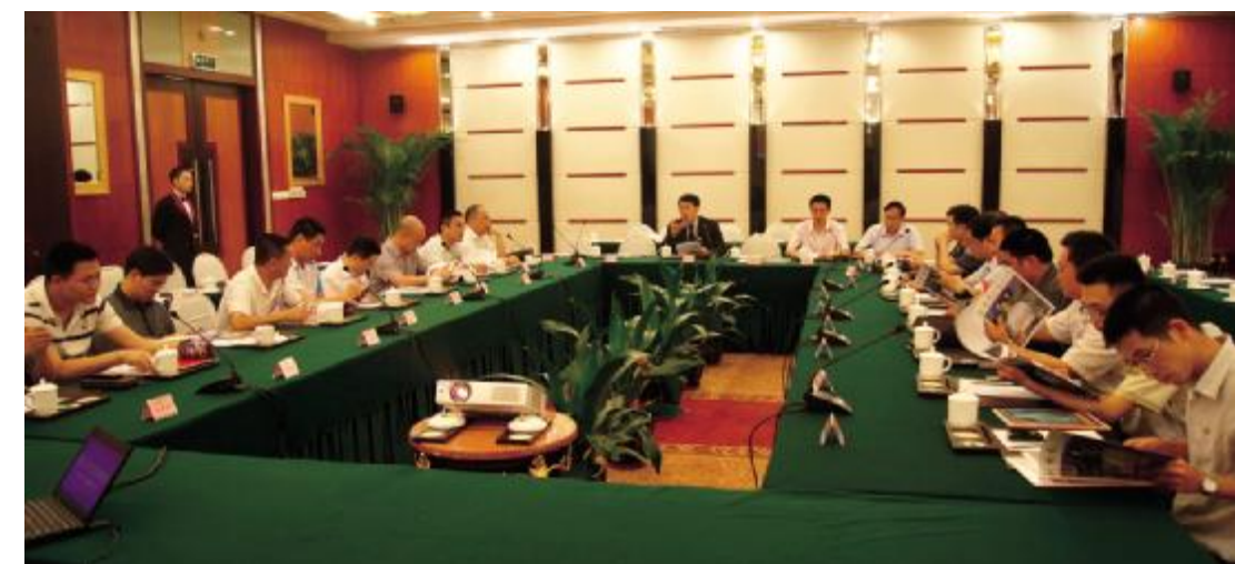
一届七次理事会现场