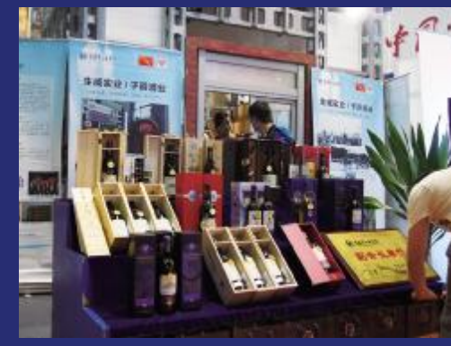
我会副会长单位—生成实业/子爵酒业参展