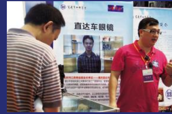
我会副会长单位—重庆直达车眼镜有限公司参展