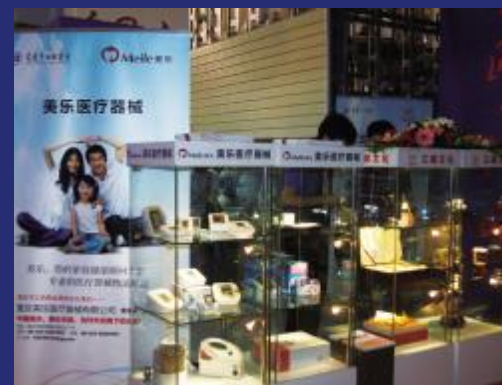
我会常务会长单位—美乐医疗器械有限公司参展