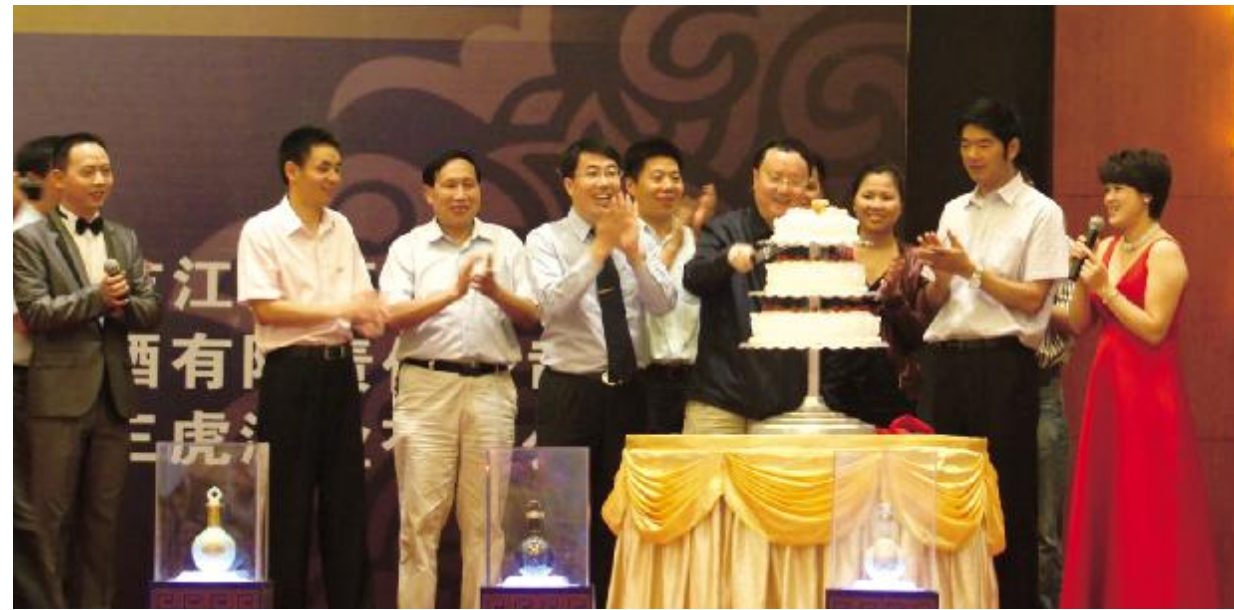
重庆市人大常委会副主任、党组副书记、我会名誉会长余远牧先生、重庆市委统战部常务副部长、市工商联党组书记丁祥龙先生与我会长部分领导共同切蛋糕象征美好祝愿的庆典蛋糕