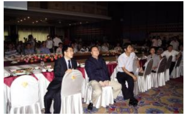
与会领导兴致勃勃的观看晚会节目