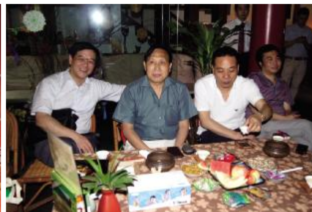
部分领导参加“工银商友俱乐部”南坪支行分部成立暨授牌仪式